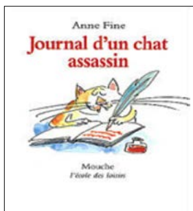
Figure 3 : couverture du Journal d'un chat assassin

Pour travailler le cercle de lecture comme outil d'apprentissage - et non plus un objet d'apprentissage -, j'ai choisi d'utiliser le livre Journal d'un chat assassin d'Anne Fine : récit court et linéaire où l'histoire se déroule sur une semaine, chaque chapitre correspondant à un jour. Le texte est écrit comme un journal intime d'un chat qui est le narrateur et raconte sa semaine extraordinaire. Un beau jour, Tuffy (le chat) est accusé du meurtre de Thumper, le lapin des voisins. Mais est-ce réellement lui le coupable? C'est au lecteur de le découvrir. Chaque élève disposait de son propre exemplaire.