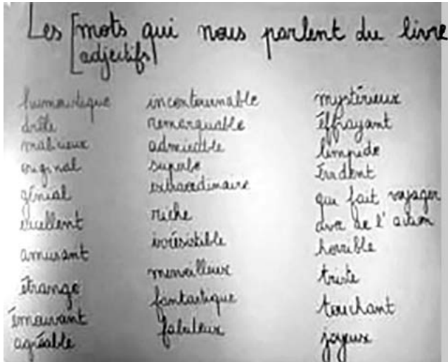
Figure 4 : listes des adjectifs « qui parlent du livre », retenus par les enfants

Ensuite, de manière autonome, les enfants ont complété la grille d'analyse de leur album en fonction des critères à observer qu'ils avaient eux-mêmes relevés dans les catalogues littéraires d'experts, et à ainsi réaliser une fiche représentative de l'album. Une fois complétées, les fiches représentatives des albums ont permis de réaliser le catalogue reprenant toutes les descriptions et les observations des albums des enfants, ainsi que le résumé de l'œuvre autour de laquelle ils avaient travaillé.