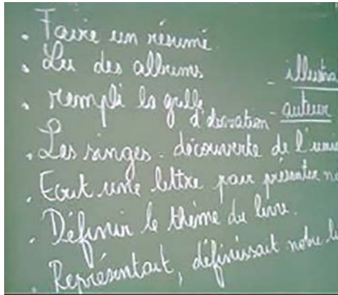
Figure 7 : réponses des enfants à la question Qu'a-t-on appris à faire en travaillant autour du catalogue ?