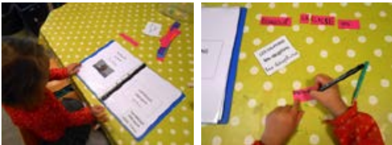
Figure 2: les élèves utilisent la farde à mots

Les enfants utilisent aussi d'autres référents de la classe. Par exemple, un voyage à la mer peut faire l'objet du courrier. Les enfants vont alors se référer à ce qui a été écrit à propos de la classe de mer. Il est arrivé qu'un enfant cherche tous les mots pour écrire la phrase : « Bonjour la classe des dauphins ».