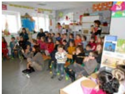
Figure 4 : les deux classes se rencontrent

La force de la correspondance, c'est que la situation est tellement significative pour les enfants que les propositions d'écriture viennent facilement, quasi spontanément. La correspondance intègre une dimension affective et un caractère fonctionnel. Le fait d'être en relation avec quelqu'un d'autre va permettre de développer toute une série d'apprentissages. La répétition de la structure globale de la lettre et la récurrence de certains contenus permettent une progression dans la découverte de l'écrit, non seulement de sa fonction de communication, mais aussi des éléments constituants, mots, syllabes, lettres qui les composent.